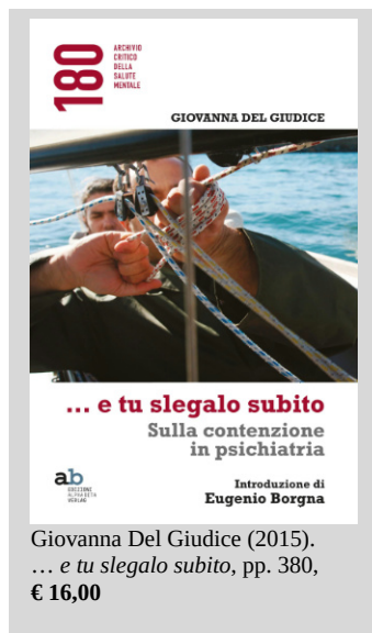
Giovanna Del Giudice (2015). ... e tu slegalo subito , pp. 380, € 16,00

«Una persona legata è offesa nella dignità, negata nella soggettività e nel diritto. Inerme, abbandonata e privata di qualsiasi difesa, perde la possibilità di contrattazione, di resistenza. Violata e mortificata, è ridotta a corpo domato».