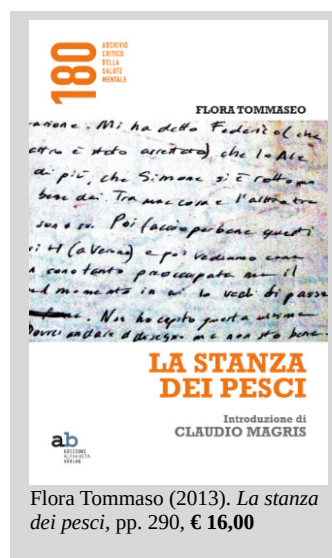
Flora Tommaso (2013). La stanza dei pesci , pp. 290, € 16,00

sicuramente è qui all'Expo per dire che in Italia come nel mondo sono troppi, troppi, gli uomini, le donne, i bambini che sono ancora legati ai letti di contenzione. Ecco queste parole vorremmo che risuonassero, Marco Cavallo si batte per questo».