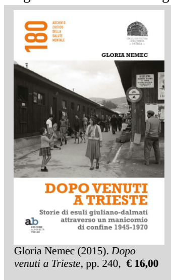
Gloria Nemeč (2015). Dopo venuti a Trieste , pp. 240, € 16,00